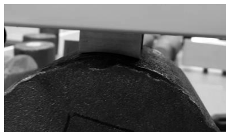
Рис. 4. Полукруглые наконечники датчика коэрцитиметра для контроля твердости готового изделия

Кроме задачи мобильного неразрушающего контроля блоки коэрцитиметров КСП-01, объединенные в сеть (на шине RS-485), могут быть использованы для создания систем непрерывного мониторинга стальных конструкций или автоматизированных измерительных комплексов диагностики изделий в металлургии и машиностроении