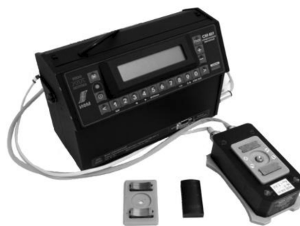
Рис. 1. Коэрцитиметр серии КИФМ

оценка механических свойств стального проката, рассортировка сталей по маркам, контроль одноосных механических напряжений [5]. Как правило, все коэрцитиметры прошлого века и их современные наследники (рис. 1) состоят из настольного блока ввода-вывода информации и управления и внешнего датчика, подключенного к блоку с помощью кабеля.