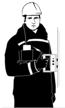
Рис. 3. Использование прибора в полевых условиях, в нагрудном кармане специалиста мобильный телефон на базе ОС Andoroid

применяется для решения задач мобильного периодического мониторинга потенциально опасных объектов, в том числе находящихся в труднодоступных местах. На рис. 3 показано использование прибора в полевых условиях. Специалист держит прибор одной рукой и, нажимая на кнопку опроса, встроенную в ручку, проводит измерения коэрцитивной силы в нужных местах исследуемого объекта. При этом рабочему не обязательно смотреть на индикацию прибора – об успешном считывании и сохранении показаний в памяти телефона он узнает по специальному звуковому сигналу, который он слышит в наушнике, когда данные считаны, переданы и сохранены в коммуникатор.