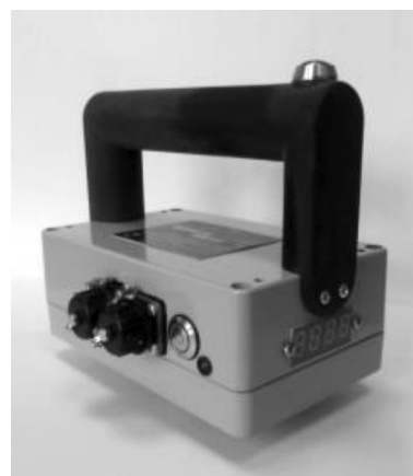
Рис. 2. Портативный коэрцитиметр-структуроскоп КСП-01

Второй важной особенностью, которая была заложена в коэрцитиметр вследствие повсеместного распространения мобильных коммуникаторов, стало наличие в приборе КСП-01 модуля беспроводной связи Bluetooth. Благодаря встроенному в прибор беспроводному модулю и наличию бесплатного программного обеспечения для коммуникаторов на базе ОС Android появилась возможность использовать прибор совместно с телефоном или планшетным компьютером. В настоящее время этот подход